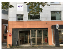
LA ROCHE-SUR-YON 110 bd d'Italie