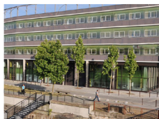
NANTES - Siège social 29 quai François-Mitterrand