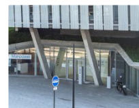
ANGERS 29 rue Auguste Gautier