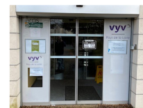
LE MANS 84 rue du Miroir