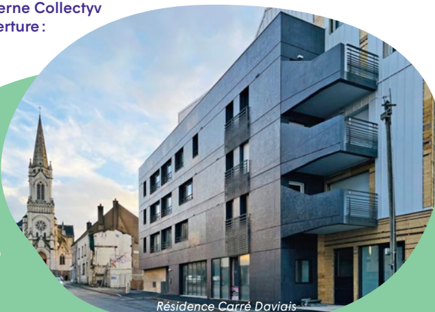
Résidence Carré Daviais

* À l'heure où nous écrivons ces lignes, les ouvertures sont programmées au premier trimestre 2024.