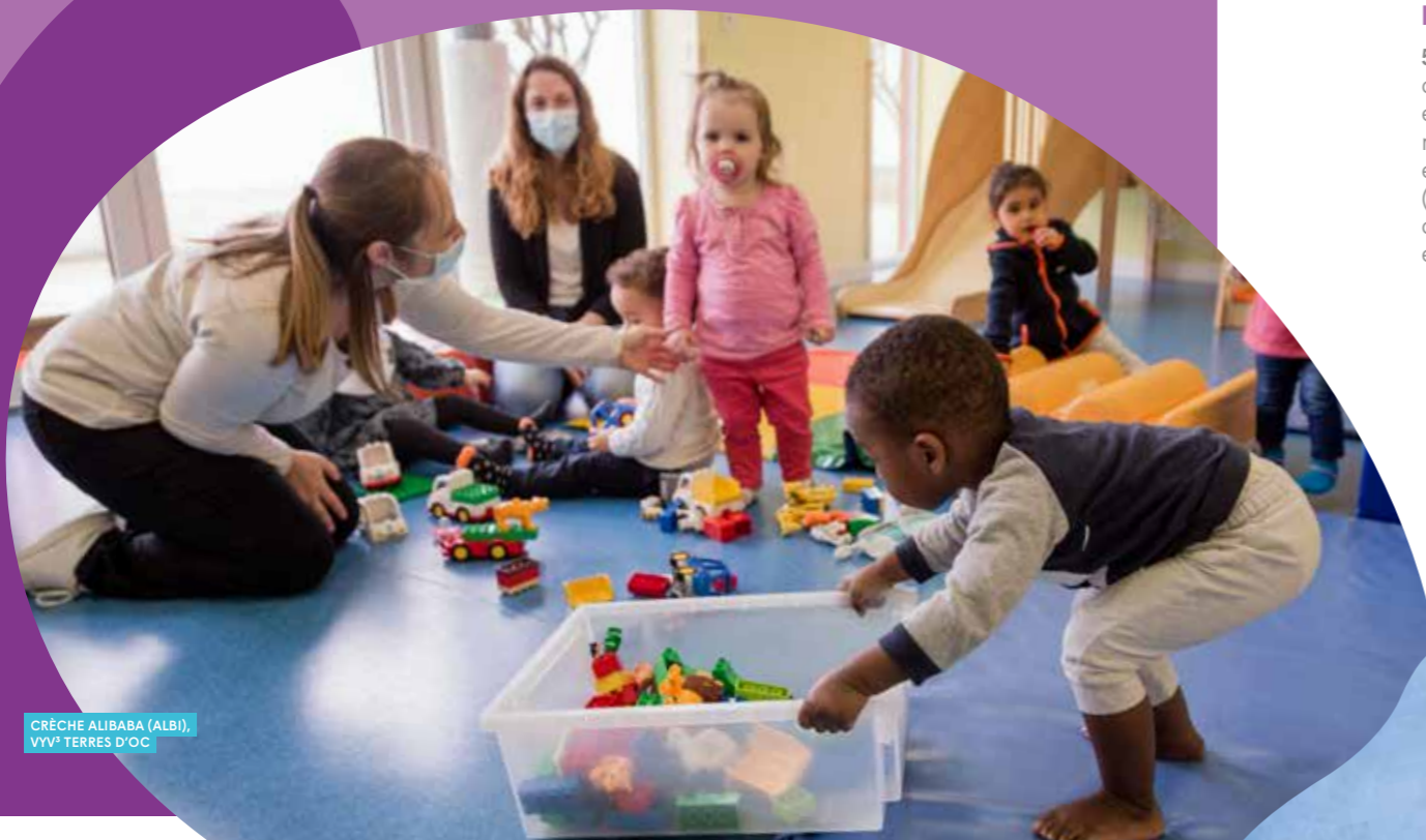
CRÈCHE ALIBABA (ALBI), VYV 3 TERRES D'OC

La force de VYV 3 réside dans son maillage et son ancrage territorial : en s'appuyant sur nos entités gestionnaires présentes dans plus de 81 départements, nous pouvons apporter des réponses spécifiques et innovantes aux besoins des populations locales en matière de soins et d'accompagnement.