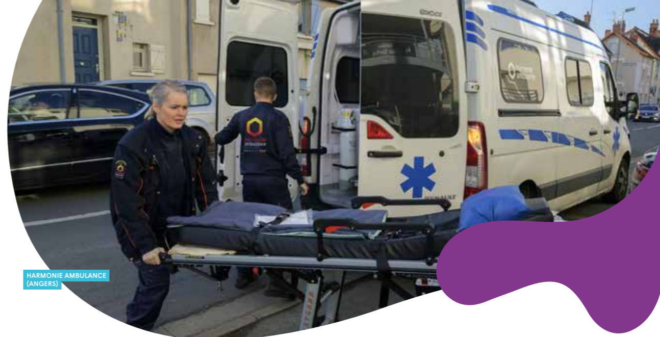
HARMONIE AMBULANCE (ANGERS)

Être au cœur des territoires, c'est s'engager localement en tant qu'acteur de santé, acteur social et acteur économique. C'est contribuer à une meilleure qualité de soin et de vie.