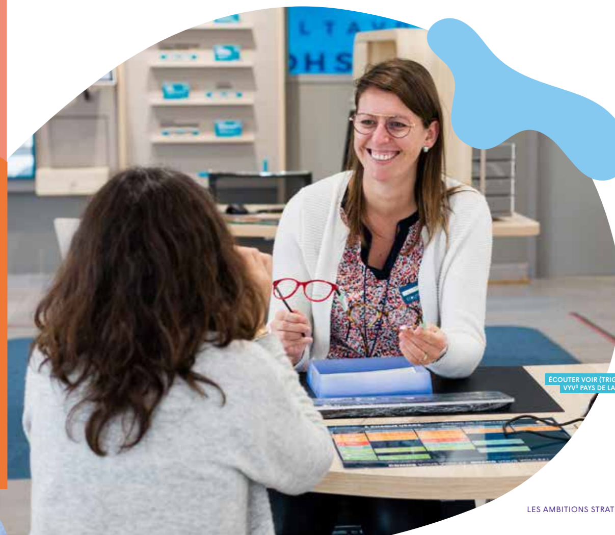
ÉCOUTER VOIR (TRIGNAC), VYV 2 PAYS DE LA LOIRE

Les feuilles de route stratégiques du Groupe VYV et de VYV 3 sont indissociables. Cinq ambitions prioritaires spécifiques à VYV 3 sont portées dans VYV > 2025 du fait de leur synergie forte avec l'ensemble des maisons du groupe.