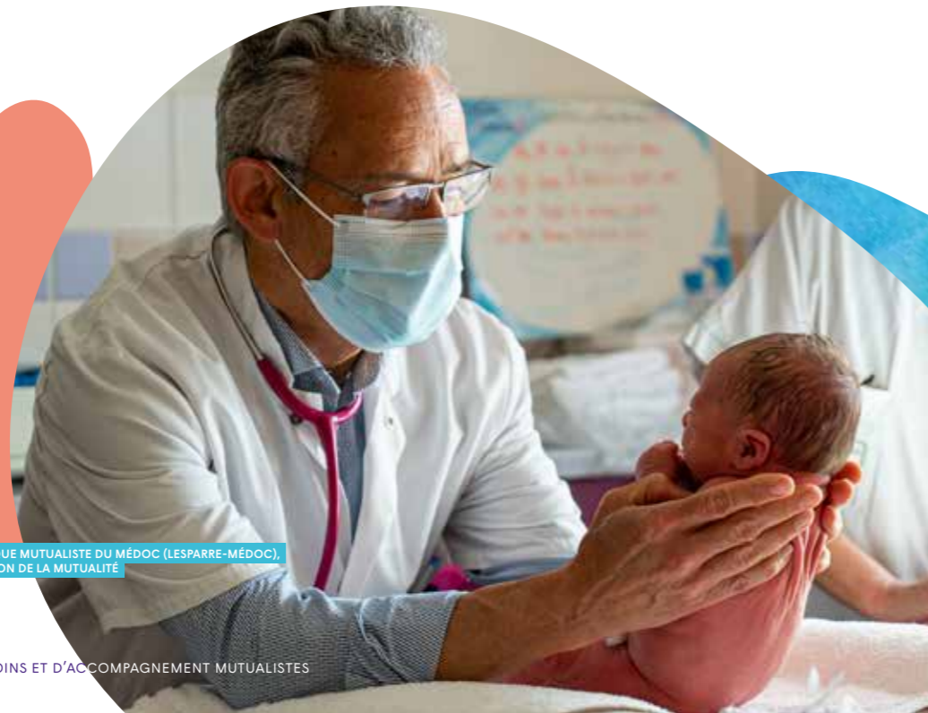
CLINIQUE MUTUALISTE DU MÉDOC (LESPARRE-MÉDOC), PAVILLON DE LA MUTUALITÉ

Nos activités sont réparties dans trois pôles métiers : soins, accompagnement, produits et services. L'innovation et la prévention sont des priorités que VYV 3 met au service de la qualité des soins et de l'accompagnement pour tous et tout au long de la vie.