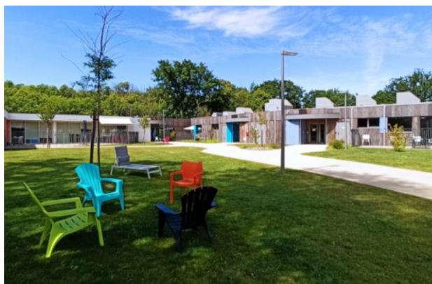
APRES : Un lieu de vie agréable organisé en maisons et ouvert sur l'extérieur