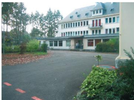
AVANT : Le bâtiment historique de la MAS-FAM devenu inadapté

Au cœur du Hameau Sésame, se trouve un « pôle soins » relié à la MAS. Ce lieu central accueille les professionnels médicaux et paramédicaux (infirmiers, psychomotriciens, psychologues, kinésithérapeute, ergothérapeute, médecins...) et dispose d'espaces communs tels que la salle multi-sensorielle (espace conçu avec des éléments fournissant des stimulations sensorielles grâce au son, à l'éclairage et à la température) et une salle de psychomotricité.