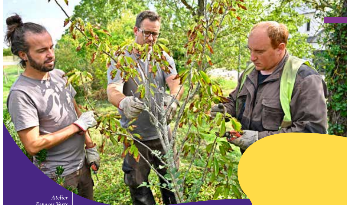
Atelier Espaces Verts ESAT Bord de Loire

190 ÉLUS engagés au sein de VYV 3 Pays de la Loire.